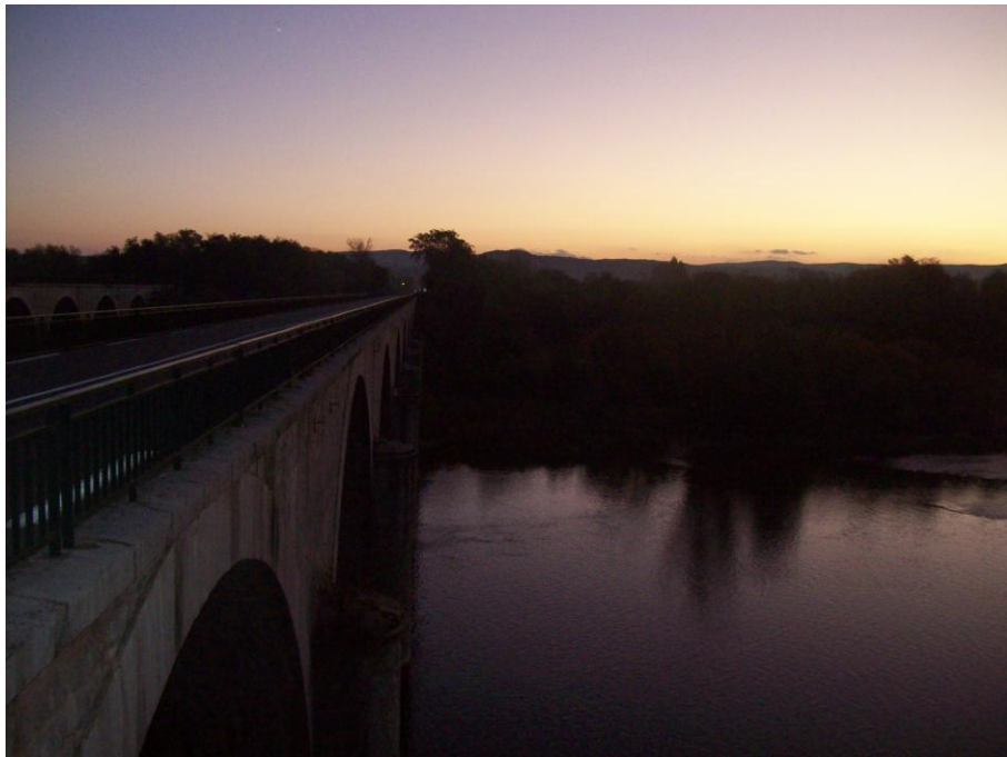
Noch versteckt sich die Sonne hinter den Bergen

Nach einem erholsamen Schlaf bin ich schon um kurz vor 07:00 Uhr wach. Wohl wissend, dass die Anderen noch in den Federn liegen, ich dazu aber keine Lust mehr habe, stehe ich auf und sitze gleich nach der Morgentoilette auf der Elfhunderter. Es ist frisch morgens, nach der nachmittäglichen Hitze von 36 Grad im Schatten ist es nur noch 14 Grad warm. Mit dem schwarzen Thermorolli unter der UVEX-Jacke ist das kein Problem. Durch den bereits erwähnten, optimalen Schutz der Hände durch Verkleidung und Spiegel kann ich gut mit meinen neuen Fahrradhandschuhen fahren.