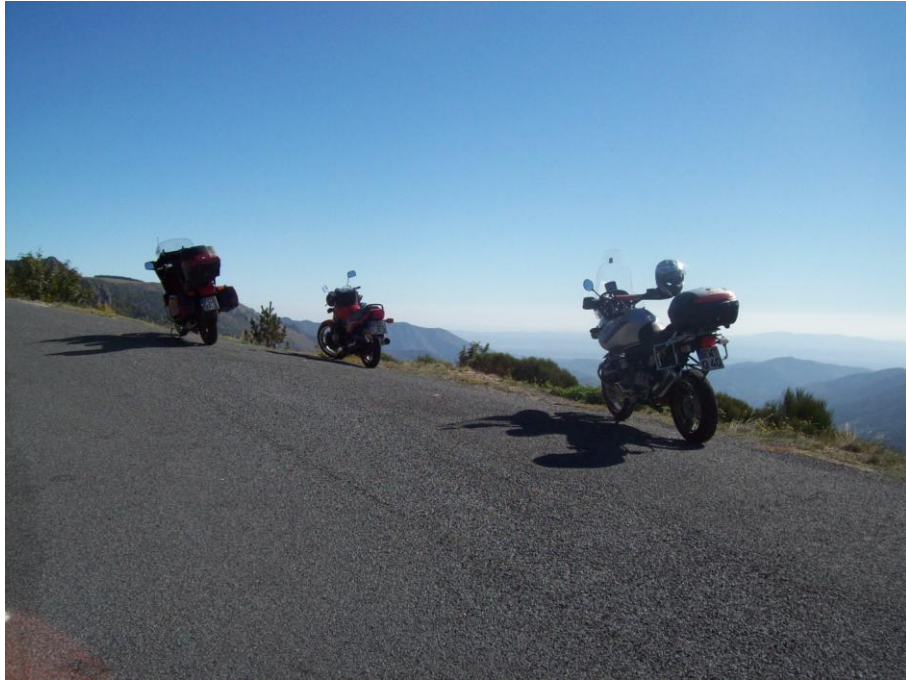
Nichts für schwache Nerven: abenteuerliche Bergsträßchen ohne Randsicherung

Nach dem Auftanken im brütend heißen Tal verziehen wir uns umgehend wieder in die schattige Kühle der Berge. Auf dem nächsten Pass, ich habe nicht mehr aufgepasst, wie der heißt, steht das „Hôtel des Cevennes“, eher eine Art Berghütte, aber dort versorgt uns der noch recht junge und weit gereiste Wirt mit heißen Getränken.