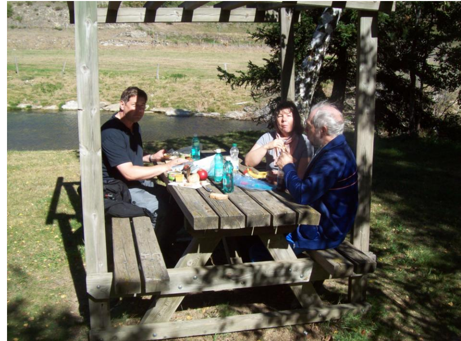
Mittagspause am Bach

Wochenenden ist der Platz wohl ein Motorradtreff, heute sind wir die einzigen Gäste, die auf zwei Rädern angereist sind.