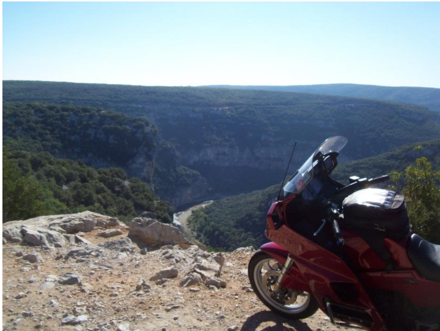
Hoch über der den gorges d'Ardèche

Auf dem Rückweg passieren wir in Vallon Pont d'Arc einen Laden, vor dem ein paar Roller, Mofas, Leichtkrafträder und Fahrräder stehen. Ich wittere erneut eine Chance, meinem Handschuh-Dilemma zu entkommen. Da meine superleichten Büse-Sommerhandschuhe seit der letzten Saison wie vom Erdboden verschluckt sind, fahre ich seitdem notgedrungen mit den Gefütterten von Reusch. Abgesehen vom fehlenden Feingefühl sind die bei dieser Hitze unerträglich, weshalb ich seit Sonntagmittag ohne Handschuhe fahre, Verkleidung und Spiegel bieten guten Wind- und Insektenschutz.